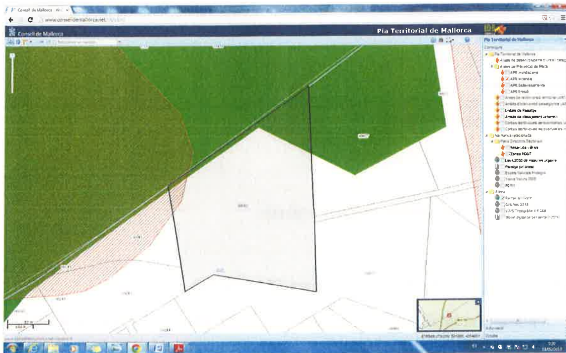
Planimetria Pla Territorial de Mallorca