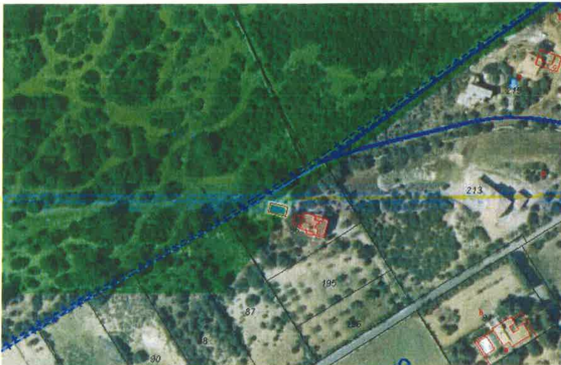
Foto 2. El límit de la zona forestal no és paral·lel a la paret seca.

agrandint, de manera que a les parcel·les pròximes la franja s'ha eixamplat considerablement (parcel·la 86, 87, 88), la qual cosa reafirma que els criteris adoptats no tenen a veure amb la paret existent i conseqüentment no es tracta d'un problema d'imprecisió.